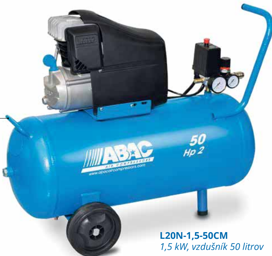
L20N-1,5-50CM 1,5 kW, vzdušník 50 litrov

Pohodlná manipulácia vďaka pridanému držadlu na tlakovej nádobe