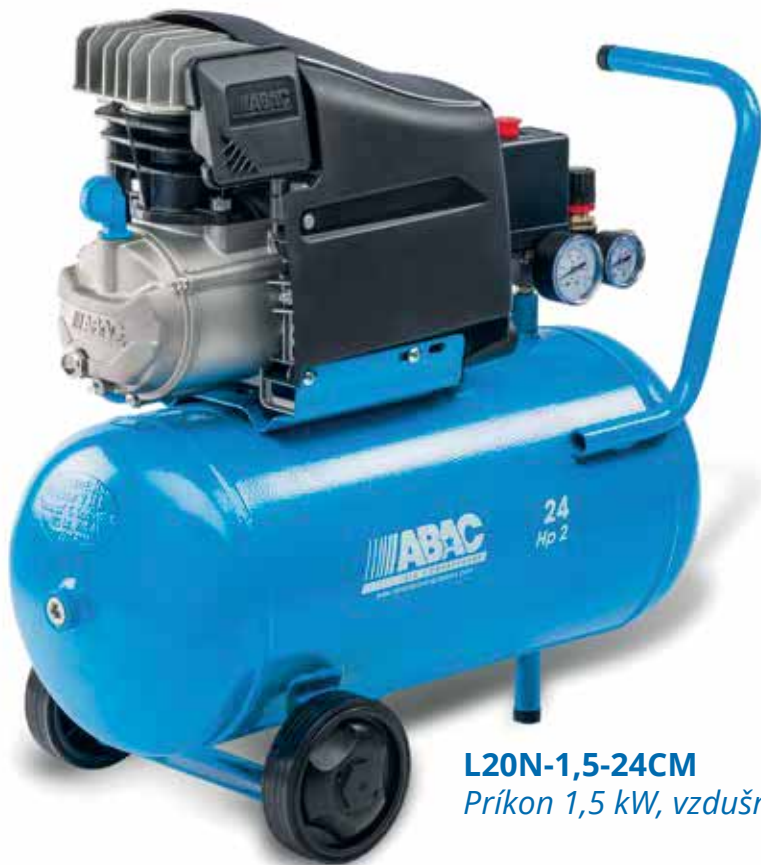
L20N-1,5-24CM Príkion 1,5 kW, vzdušník 24 litrov