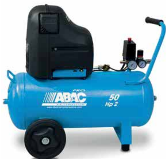
O20PN-1,5-50CM 1,5 kW, vzdušník 50 litrov