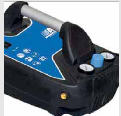
Bezolejová jednotka so sacím výkonom 180 l/min