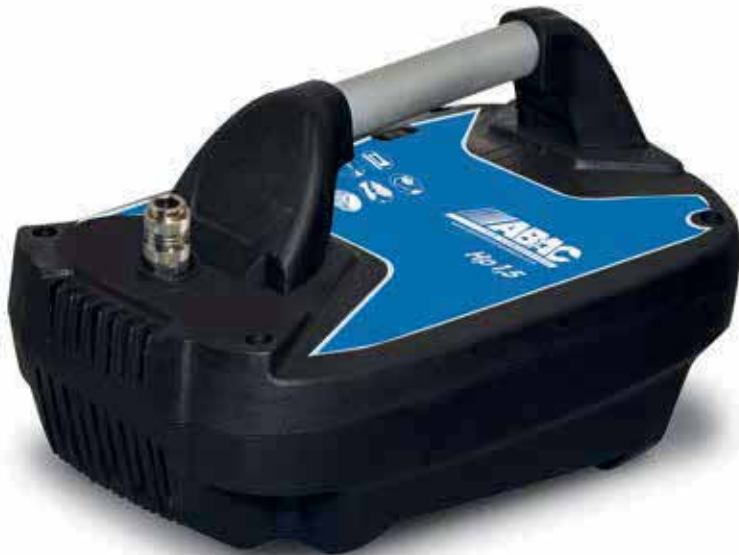
O15N-1,1-CM 1,1 kW, bez vzdušníka

Bezolejové profesionálne kompresory s priamym pohonom v prenosnom a mobilnom prevedení určené pre menšie remeselnícke aplikácie.