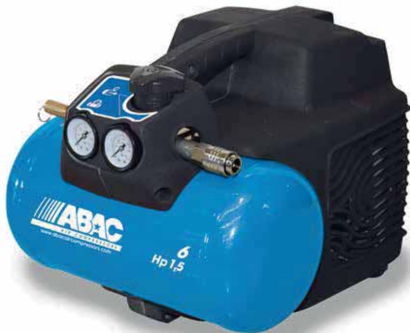
O15N-1,1-6CM 1,1 kW, vzdušník 6 litrov