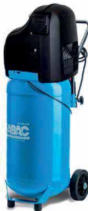
O20PN-1,5-50VM 1,5 kW, vzdušník 50 litrov