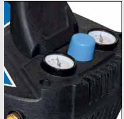
Regulátor tlaku a dva manometre pre odpočet tlaku