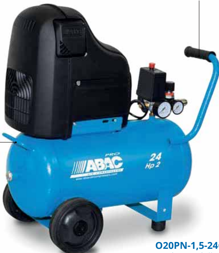
O20PN-1,5-24CM 1,5 kW, vzdušník 24 litrov

Pohodlná manipulácia vďaka pridanému držadlu na tlakovej nádobe