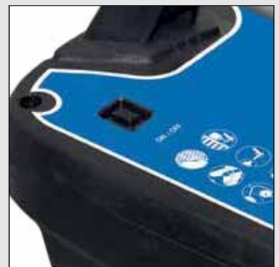
Jednoduché zapínanie a vypínanie pomocou tlačidla