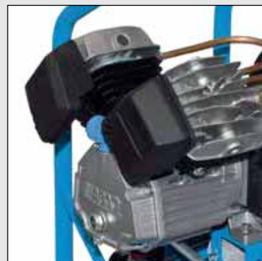
V30-2,2-2x11CM 2,2 kW, vzdušník 2x11 litrov

Silná jednotka s 2 liatinovými valcami usporiadanými do „V“